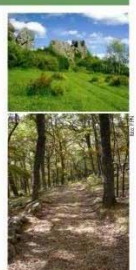
Antes de pasar del Alto de los Castillos. Abajo: gran parte de la ruta discurre por el interior de hermosos bosques de rebollo.

izquierda, un breve desvío se asoma a la divisoria de vertientes, desde la que se domina una excelente panorámica de todo el entorno: desde la solana que acabamos de recorrer hasta las sierras y montañas que, por el oeste, conforman el macizo más abrupto de la Montaña Palentina, y hasta los páramos y llanuras que se abren hacia el sur en dirección a la meseta del Duero. Volviendo al cruce anterior, la ruta inicia el descenso hacia el punto de partida, por una senda que discurre mayoritariamente por el interior del bosque hasta las inmediaciones de la ermita de Nuestra Señora del Carmen. Siguiendo la carretera que da acceso a este santuario, el circuito se cierra por la primera pista de tierra que sale a la izquierda de la calzada. Este camino de uso agrícola discurre entre prados de siega hasta las inmediaciones de Villabellaco, donde salva el cauce del arroyo Bahillo para dirigirse al pueblo por la carretera local.